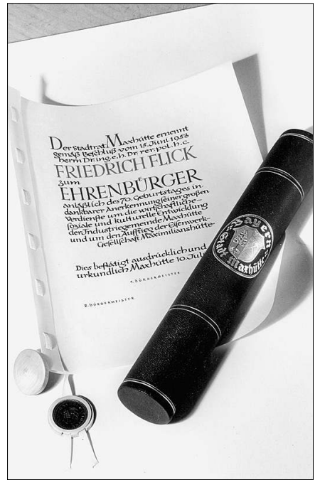
Die Ehrenbürgerurkunde der Stadt Maxhütte für Flick