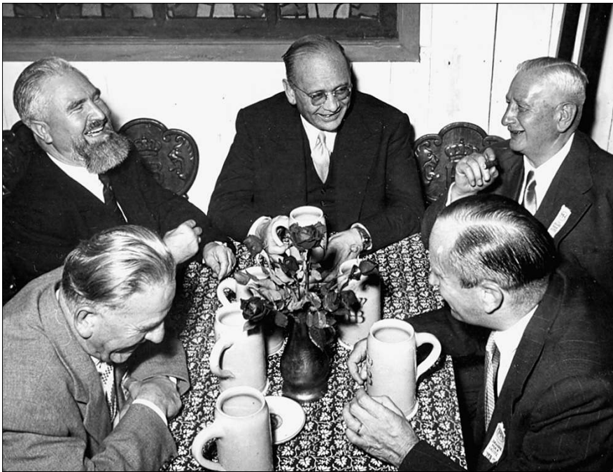
Flick (hinten rechts) mit dem bayerischen Landtagspräsidenten Alois Hundhammer (hinten links) bei der Einhundertjahrfeier der Maxhütte 1953. Die Ehrenbürgerurkunde der Stadt Maxhütte für Flick