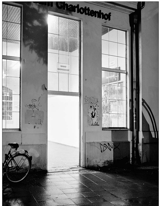
An dieser Haltestelle in Potsdam wurde 2006 ein Afrodeutscher schwer verletzt

Ihre Fotos möchten dem Geschehen eine „Bühne“ bieten. Durch die konsequente Suche nach dem Stillstand, der jedem Gewalteinbruch folgte, schafft Leitolf einen Raum für persönliche Assoziationen; ähnlich wie in ihrem vorangegangenen Bildband, in dem sie 2004 die Kriminalgeschichte von Namibia zu greifen versuchte. Nun besinnt sich Eva Leitolf auf ihre eigenen Anfänge zurück und entwickelt sie fort. All ihre Schauplätze wer-